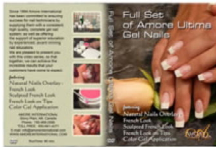
"The Full Set" demonstrerer 4 komplette procedurer