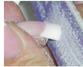
3a. (Alle 10) #3 Step

Fil højre side af free-edge med 100-grit T.T. Purple Terminator file.