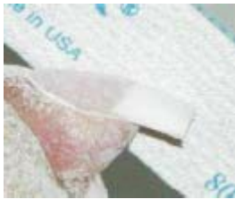
4a. (Alle 10) #4 Step

Fil spidsen af free-edge med 100-grit T.T. Purple Terminator file.