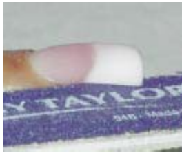
1. (Alle 10) #1 Step

Fil venstre side af free-edge med 100-grit T.T. Purple Terminator file.